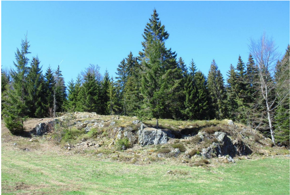
Abb. 4: Freigestelltes Felsbiotop im Frühjahr 2015 in Dachsberg (Pflegefläche LPR B 2014/2015)

Im Rahmen des Gesamtkonzeptes wurde das ca. drei Hektar große Weidfeld bereits im Jahr 2014 in einen LPR A Vertrag überführt und eine gezielte Adlerfarnbekämpfung im Vertrag aufgenommen und vergütet.