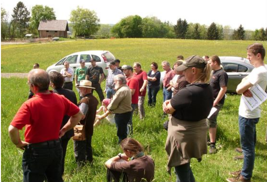
Abb. 5: Teilnehmer des Grünlandtages am Rande einer FFH-Mähwiese (Albrück-Unteralpfen)

Die besichtigte Mähwiese befindet sich im FFH-Gebiet „Wiesen bei Waldshut“.