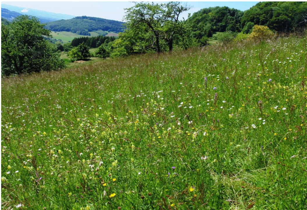
Abb. 3: Kalkmagerrasen im Mai 2015 in Küssaberg (Beispiel einer Pflegefläche LPR Teil A)

Die LPR A Verträge werden grundsätzlich über eine Laufzeit von fünf Jahren abgeschlossen. In der Regel sehen die Verträge die Beibehaltung einer extensiv - pflegenden Bewirtschaftung auf landwirtschaftlich nutzbaren Flächen mit hoher ökologischer Wertigkeit vor. Des Weiteren werden Verträge auch auf nicht landwirtschaftlich nutzbarer Fläche, zur Pflege und Entwicklung dieser Bereiche, abgeschlossen.